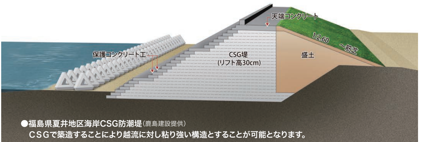
●福島県夏井地区海岸CSG防潮堤

福島県で建設された「夏井地区海岸防潮堤」は、東日本大震災で発生したコンクリートガラを用いて、CSG技術により築造されています。