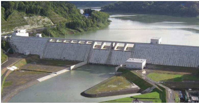
●台形CSGダム型式で建設された当別ダム(北海道)

CSG (Cemented Sand and Gravel) は、建設現場周辺で手近に得られる材料にセメントと水を添加し、簡易な施設で製造するもので、材料特性としては、“土”と“コンクリート”の中間的なものと位置付けられます。この技術はダム分野で開発され「台形CSGダム」として全国で既に4つのダム(当別ダム、厚幌ダム、サンルダム[いずれも北海道]、金武ダム[沖縄県])が完成しています。